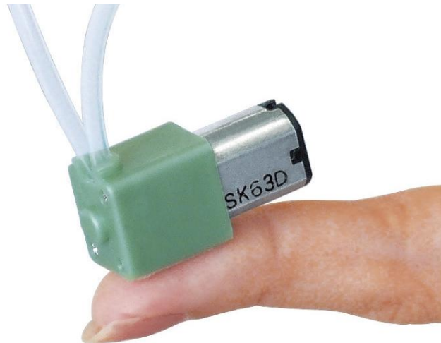
指尖大小的蠕动泵